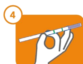
4 Lecture du résultat

Streptatest® est un test d'orientation diagnostic à destination des professionnels de santé. Dispositif médical de diagnostic in vitro. Lire attentivement les instructions figurant dans la notice d'utilisation avant utilisation.