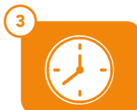
3 5 MINUTES Immersion du test