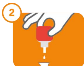
2 1 MINUTE Mise en contact du prélèvement avec les réactifs